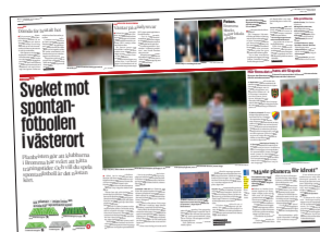
Mitt i Bromma den 10 oktober.

En del tycker att det är dåligt att bygga fotbollsspelare för de tror inte att det behövs, men det behövs ju för fotboll är en känd sport som många spelare och tycker är kul.