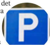
Bristvara i Blackeberg.